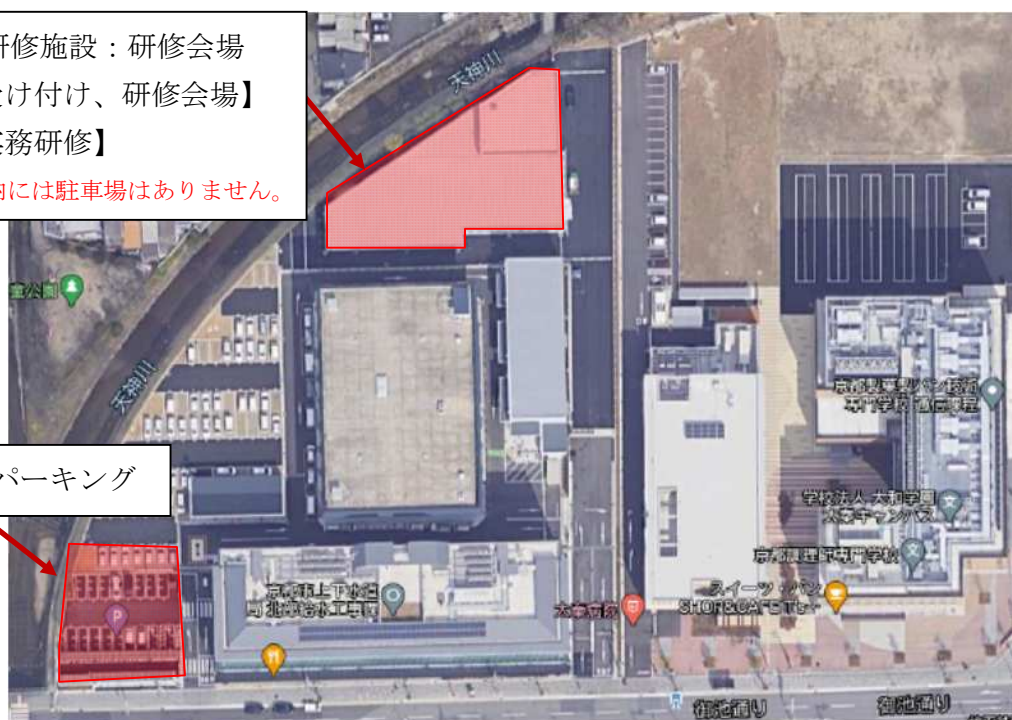
図 4 コインパーキング～水道技術研修施設