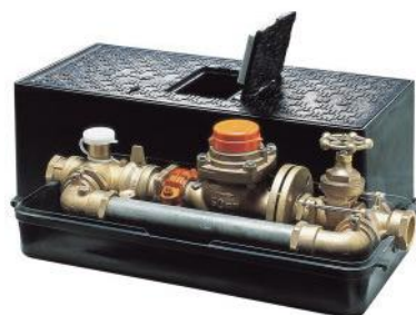
図3 メータバイパスユニット(呼び径 50)