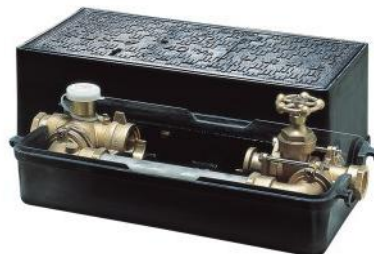
図2 メータバイパスユニット(呼び径 40)

現在メータバイパスユニットは、全国的な普及と共に、逆止弁内蔵型など各種の機能、バリエーションが増えており、マンションのような集合住宅に限らず、業務上断水できない工場や公共施設、深夜にメータ交換を依頼される飲食店などにも採用され、用途が広がっております。