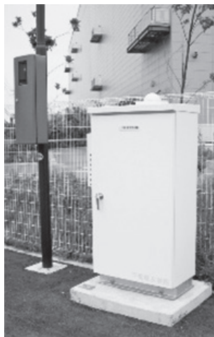
写真1 監視装置の外観

また、電源の確保や通信機器などを整備する必要がありますので、水質自動監視装置の設置にあたっては、設置場所の選定やメンテナンス費用を含めた総合的なコストを十分に考慮して導入する必要があります。