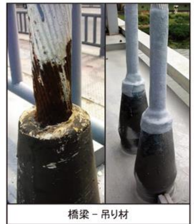
橋梁 - 吊り材