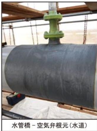
水管橋 - 空気弁根元 (水道)

腐食老朽化した水管橋の配管や、配管を支持する橋梁構造部（吊材、ガセットプレート、格点部、支承部など）の腐食進行を防ぎ、延命化を図る技術です。ウルトラワックステープは、常温固体のマイクロクリスタリンワックス（JIS K 2235 石油ワックス）を主成分としているため、経年による油分流出がほとんどなく、厳しい腐食環境下においても25年以上防食効果が持続します。