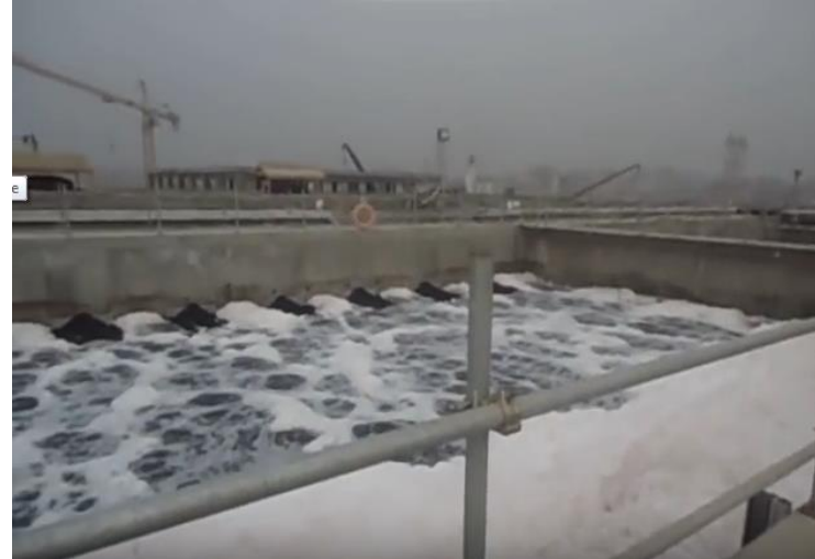
Biological Nitrification System