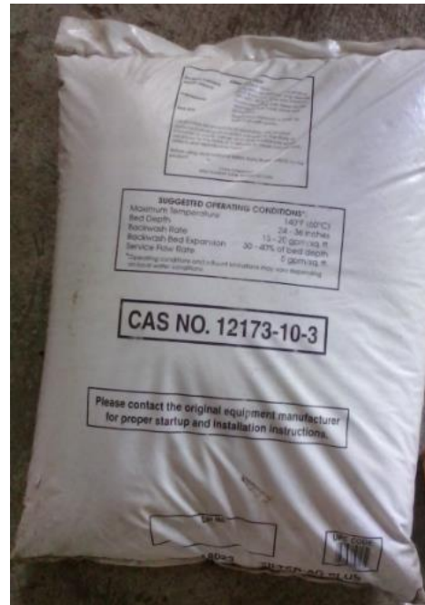
A bag of Clack Filter Ag-Plus (enhanced performance filtration media)