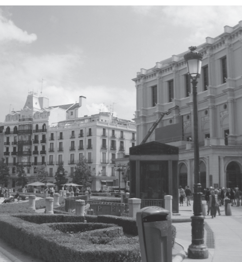
観光客も多いマドリッド市内

運営公社である。両公社とマドリッド州政府との関係を左上の図に示す。 ここで、スペインの地方行政区画を簡単に整理すると、大きい順に「州」「県」「(基礎)自治体」と続き、全50県が17の州にまとめられているが、マドリッド州は1州1県制なので、州内にはマドリッド県だけがあつて、そのなかに首都マドリッドとその他178の自治体がある(地図と左図)。自治体は一樣にムニシピオ Municipio と呼ばれ、日本の市町村のような区別はない。また、1州1県制をとる全7州において、州と県の面積は等しく、マドリッド州の面積は8030平方キロ、日本では静岡県(7780平方キロ)が最も近い。