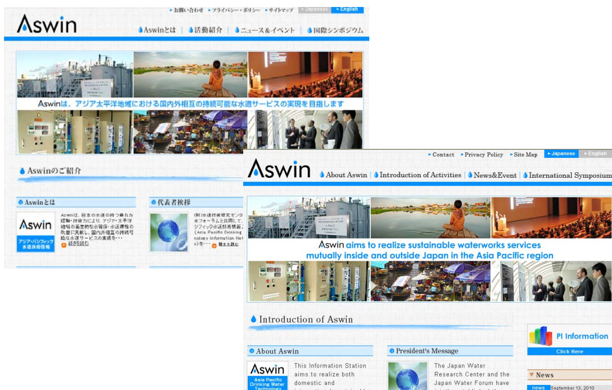
図 Aswin Web サイト (左：日本語版 右：英語版)

Aswin をベースに海外への情報発信が可能であると考えています。優れた経験や技術力を有する多くの企業や組織の参画をお待ちしています。