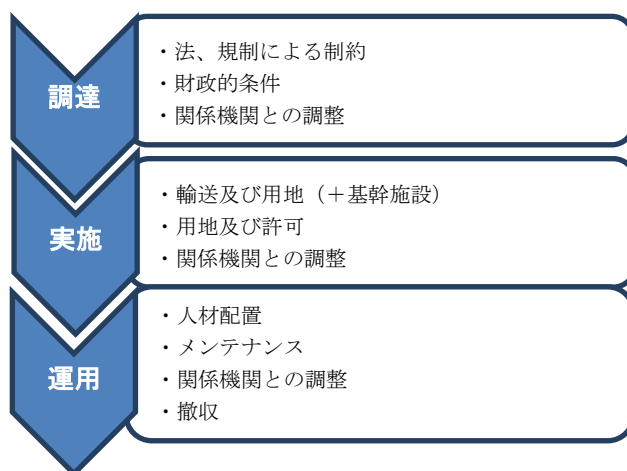
図2. 各段階において考慮すべき事項.

それぞれの要素に関して、調達、実施、運用面での考慮すべき特定事項が存在し、また、それについての評価が必要である。